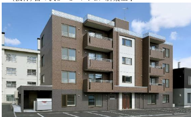
(仮称)宮の沢3-3マンション新築工事