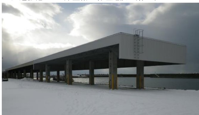
久遠漁港-4.0m岸壁衛生管理施設建築工事